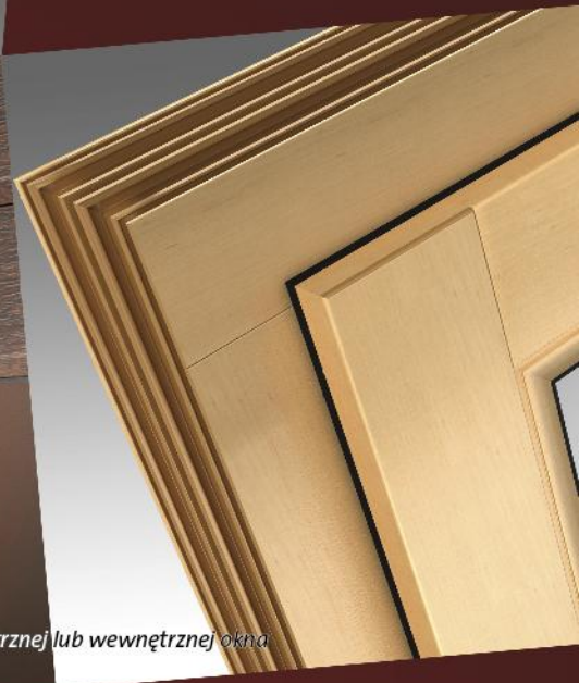
Wood Look+ od strony zewnętrznej lub wewnętrznej okna